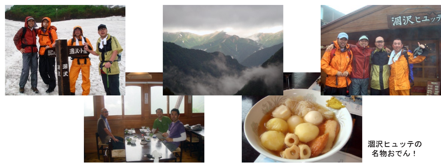
涸沢ヒュッテの名物おでん！

今シーズンの目標は、9月に北穂高岳～奥穂高岳～吊尾根～前穂高岳の縦走です。予定では9月3～4日です。どこかでお会いしたら声をお掛け下さい。何か良い事ありますよ。