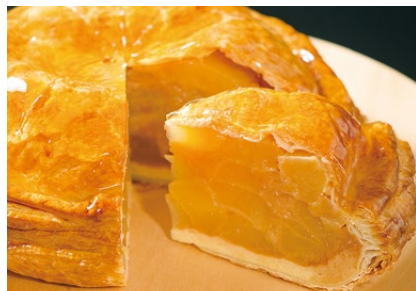
信州りんごのアップルパイ

人気の「五千尺アップルパイ」などホテルオリジナル商品から厳選した上高地のお土産を多数取り揃えております。