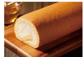
信州蜂蜜のロールケーキ