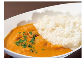
バターチキンカレー