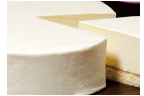
レアチーズケーキ