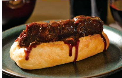
ビーフシチューサンド